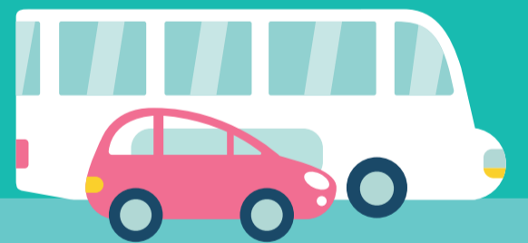
VÉHICULE PERSONNEL OU TRANSPORTS EN COMMUN