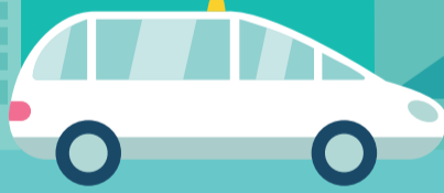
VSL* ou TAXI CONVENTIONNÉ